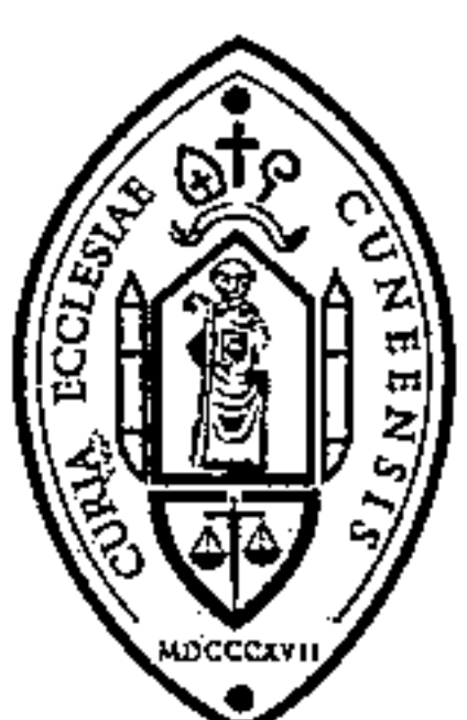
+ Piero Delbosco Vescovo di Cuneo e di Fossano